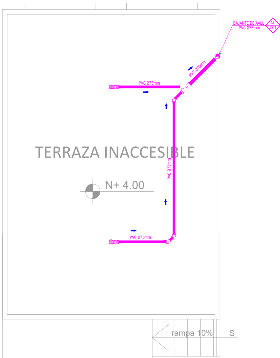
UBICACIÓN DE DESAGÜES DE CUBIERTA